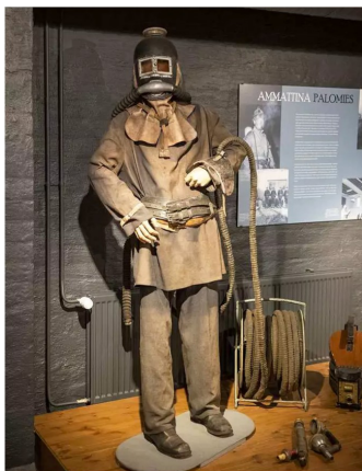
Vanha savusukeltajan kostyymi tekee vaikkutuksen. Tässäkään asussa ei riskialtis työ ole ollut helppoa.

Satakunnan Kansan Porilaisessa oli 22.5.2019 juttua tästä: