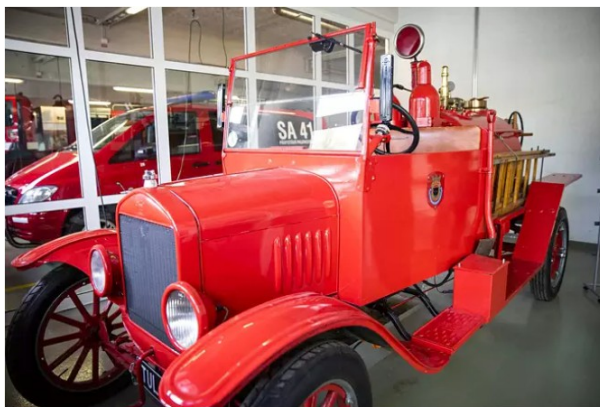
Vanha T-mallinen Ford on yleisön suosikkeja, vaikka sitä ole nähty tositoimissa vuosikymmeniin.

Eräs museonkävijöiden suosikkeja on ikivanha savusukeltajan asu 1900-luvun alusta. Siihen pukeutuneen palomiehen hapensaannista yritettiin huolehtia palkeilla, ja viilennyksestä kaulan ympärillä kulkeneella vesiletkulla.